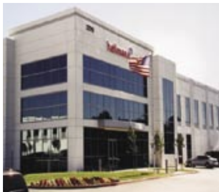
Location Los Angeles

Depois que o LFS 400 foi instalado nas três novas localizações foram adicionados aos sistemas os clientes da Hellmann